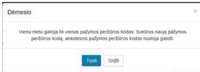
2 paveikslas. Pasirinkti tęsti veiksmą

Sistema sugeneruoja naują pažymos peržiūros e. sveikatos portale kodą, kuris parodomas atnaujintame medicininės pažymos peržiūros lange.