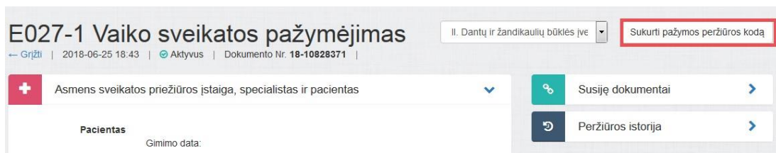
1 paveikslas. Sukurti pažymos peržiūros kodą