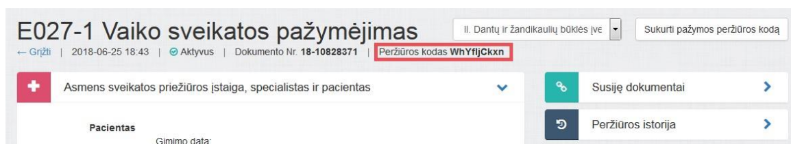
3 paveikslas. Sugeneruotas peržiūros kodas

Sistema sugeneruoja naują pažymos peržiūros e. sveikatos portale kodą, kuris parodomas atnaujintame medicininės pažymos peržiūros lange.